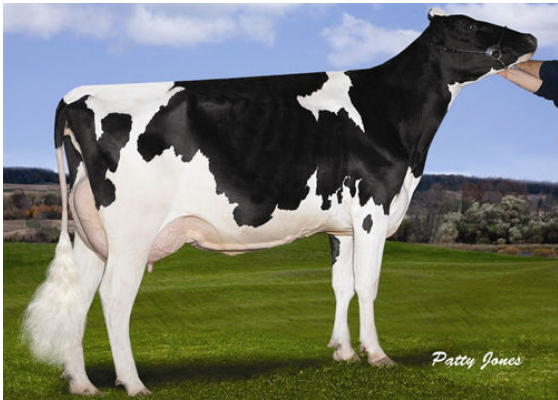
MS CHASSITY OBS CLAIRE DAM