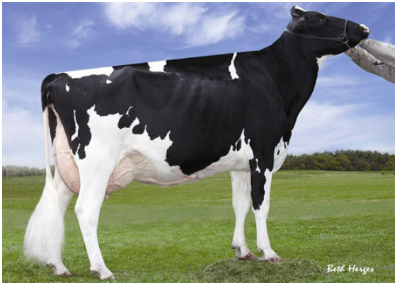
REGANCREST CHASSITY TY TL GRANDDAM